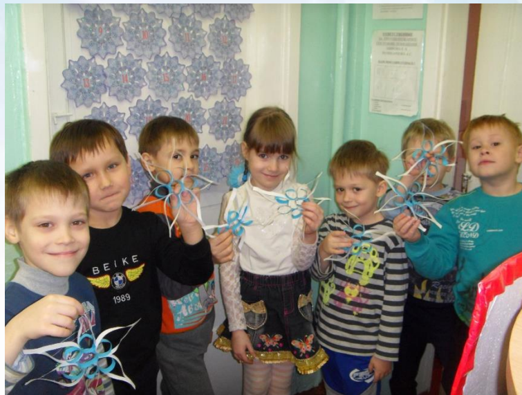
Конструирование «Вырежи снежинку»